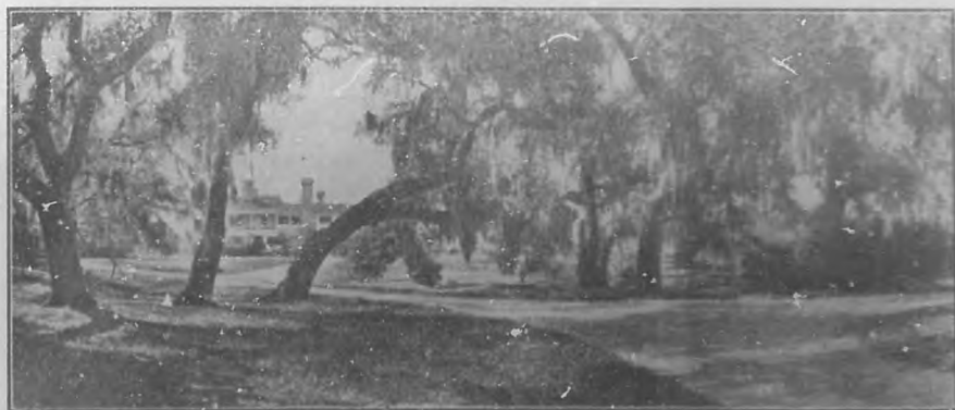
Casa de verano de Andrew Carnegie, en Eumberland Island, Fla.