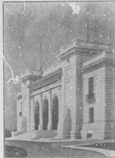
Edificio de la Unión Pan-Americana en Washington, D. C., á cuya construcción contribuyó Carnegie.