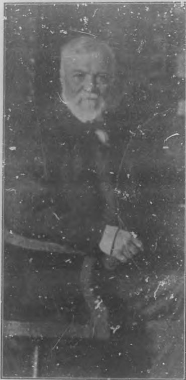
Andrew Carnegie en su estudio

En sus empresas comerciales, en las que recibió, más que en cualquiera otra, el mayor fruto de sus esfuerzos, se distinguió en la organización de la Woodruff Sleeping Car Company que más