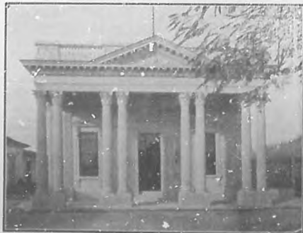
Edificio de la Sucursal del Banco Nacional de Cuba inaugurado con extraordinario éxito social el día 20 del actual en Santa Clara.