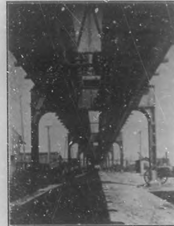
Los progresos de la República. — Elevado que será utilizado por la Compañía de los Ferrocarriles Unidos para el servicio de sus trenes, al trasladarse la estación de Villanueva á la expedición que está á punto de tenerse en los terrenos del Arsenal.

El viernes tuvo lugar el estreno de "La Noche del Sábado", de Jacinto Benavente, y el beneficio de Virginia. El teatro estuvo brillantemente concurrido y la beneficiada fué saludada con aplausos y flores al aparecer en escena. De la obra de Benavente se nos habían referi-