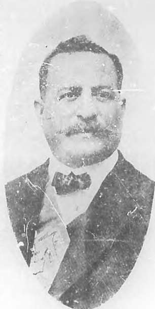
Sr. Ramón Cáceres Presidente de la República de Santo Domingo recientemente asesinado.

De las diferentes ceremonias llevadas a cabo con la mayor solemnidad y patriótico recogimiento con motivo del entierro de los restos del P. Varela, darán idea los gra-